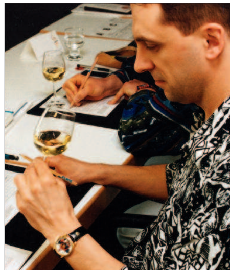
Die Wahrheit liegt im Glas. Einige der 2010er wurden sicherlich mit einer irrational hohen Säure abgefüllt.

ein alljährlich wiederkehrendes Phänomen ist, mag auf diesem Weg eine zusätzliche Säureminderung eintreten. In der Breite bleibt der BSA in Weißweinen jedoch ein Produkt des Zufalls, solange er nicht gezielt gefördert wird. Ein erhöhter pH-Wert allein genügt dazu nicht. Seine tatsächliche Höhe spielt eine wesentliche Rolle.