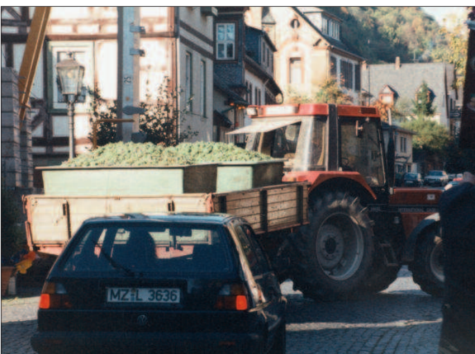
Der Jahrgang 2010 brachte eine Konzentration von Traubeninhaltsstoffen. Besonders die Säureregulierung stellte viele Winzer vor große Herausforderungen.

Die AgriDirect Deutschland GmbH startet den WinzerScanner 2011. Wie das Viersener Unternehmen mitteilte, werden während dieser telefonischen Inventarisierung mehr als 3.600 Weinbauern angerufen, um alle vorhandenen Daten zu aktualisieren sowie die Zukunfts- und Investitionspläne zu erfragen. Anlass dafür seien immer häufiger auftretende Fragen hinsichtlich des deutschen Weinbaus. Im Vorfeld seien für den WinzerScanner die Adressen von Weinbauern selektiert worden, die momentan bei AgriDirect bekannt seien. „Der Weinbau in Deutschland ist ein sehr interessanter Sektor, welcher ständig in Bewegung ist“, erklärte AgriDirect-Geschäftsführer Thieu Hendriks. Dank des neuen WinzerScanners könne der Markt mit aktuellen Informationen wie der zukünftigen Entwicklungsplanung versehen werden. Außerdem könnten so ab dem nächsten Jahr mehrjährige Trends dargestellt werden. Die Ergebnisse der Untersuchung sollen im August vorliegen. AgE